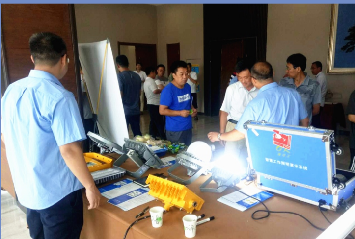
济南电煤与客户一起开展智慧照明系统交流会，通过介绍公司LED产品的特点和智慧照明系统的功能介绍，让客户更精确的了解公司的产品，让客户真正认识到智慧照明系统能有效

做好一件事情的前提，就是抓住本质。如何抓住本质？过去我们的确困惑过，既不知道本质在哪里，又不知道如何去抓，有时甚至是眉毛胡子一把抓。现在我们不仅要学会用这个方法，还应该养成多问几个为什么的工作习惯。当自己遇到问题时，不妨多问自己几个为什么；当我们在指导别人工作时，也多问别人几个为什么，如此一来，我们就会不断提高发现和判断问题，分析和解决问题的能力，就会给别人带来价值。